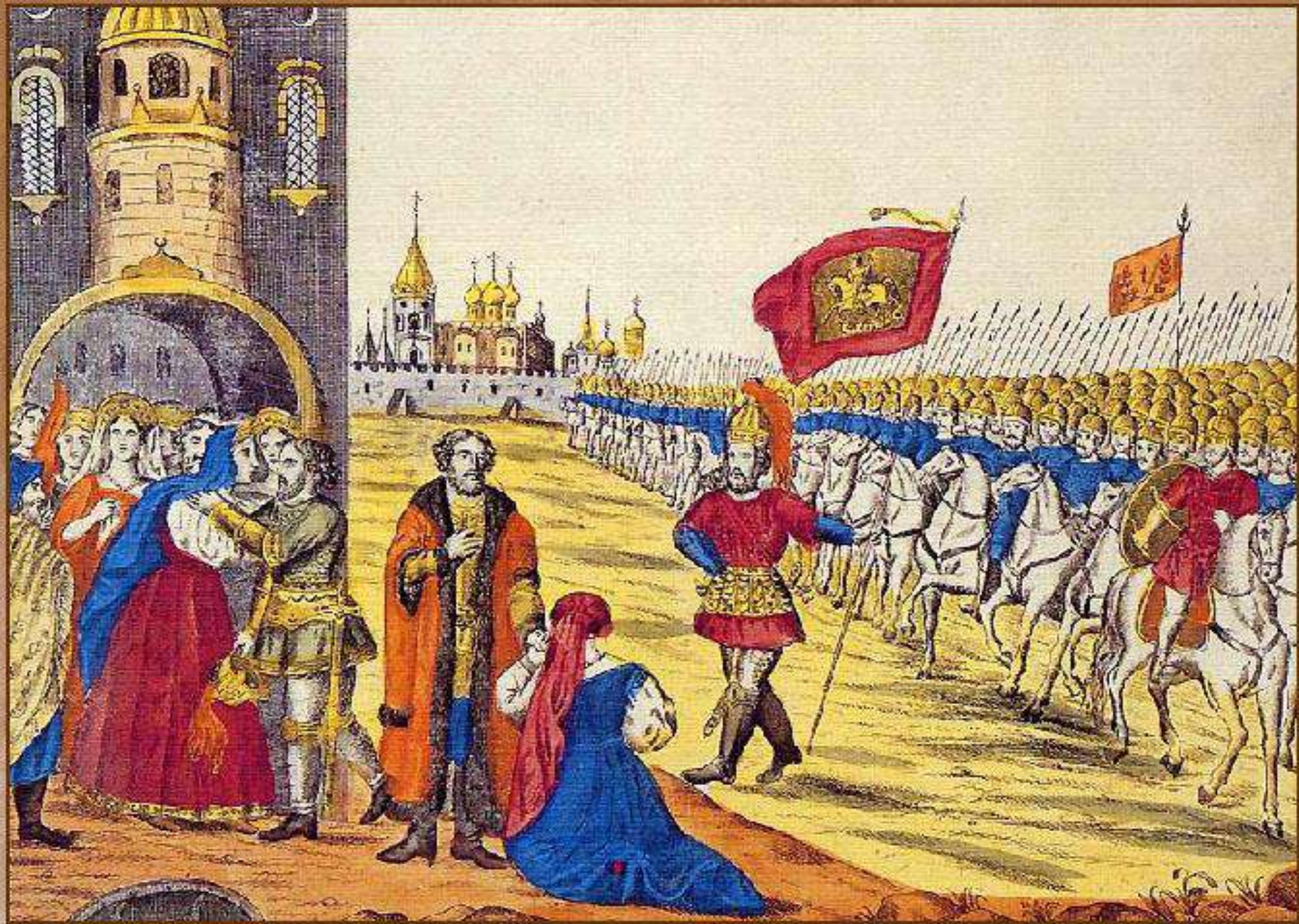
Гражданин Минин и князь Пожарский