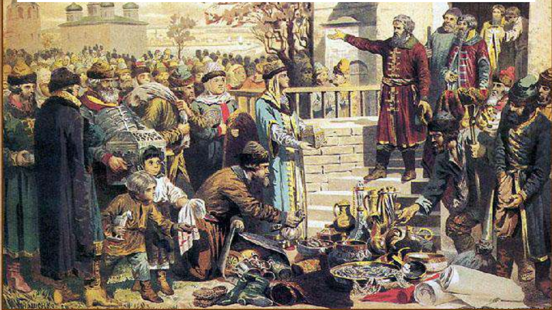
Воззвание Козьмы Минина к нижегородцам

Осенью 1611 г. по призыву нижегородского купеческого старосты К. Минина началось формирование народного ополчения.