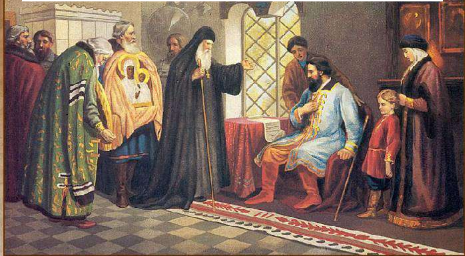
Нижегородские послы у князя Дмитрия Пожарского. 1611 г.