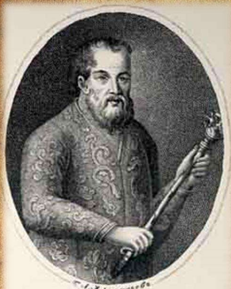
Князь Дмитрий Михайлович Пожарский, Сиверский.

Князь Пожарский, став во главе ополчения, принял всю власть над Русской землей, но остался скромен и прост в обращении.