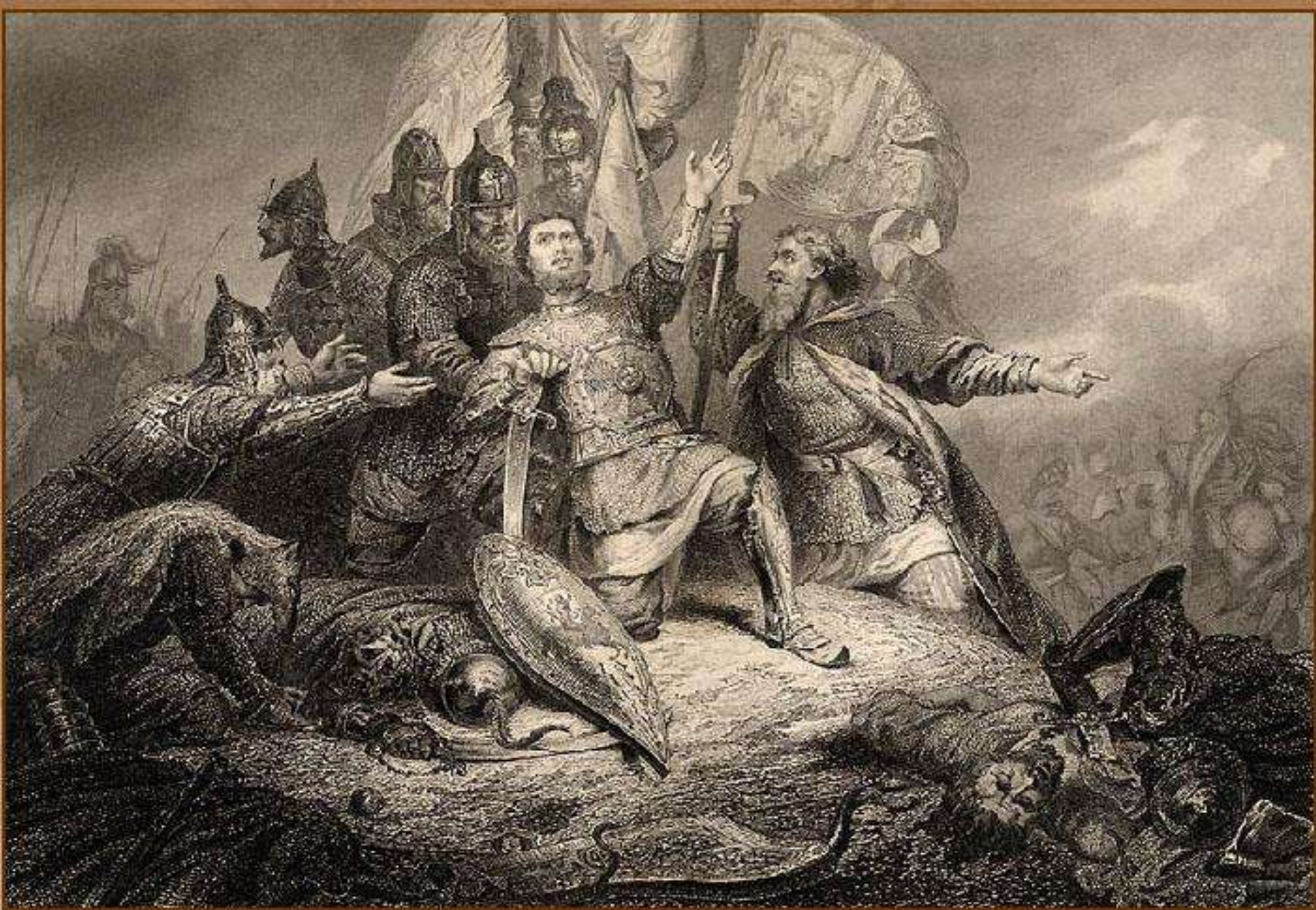
Пожарский в битве под Москвой