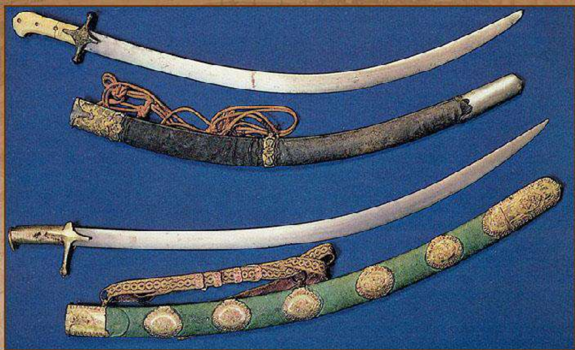
Сабли К. Минина и Д. Пожарского