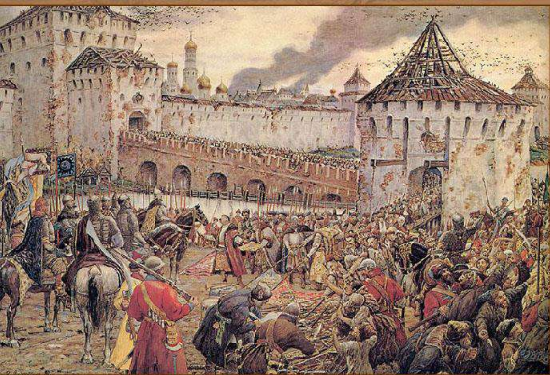
Изгнание польских интервентов из Московского Кремля в 1612 г.