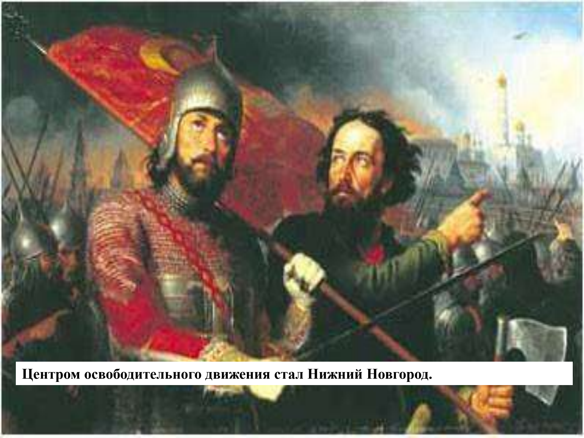
Центром освободительного движения стал Нижний Новгород.