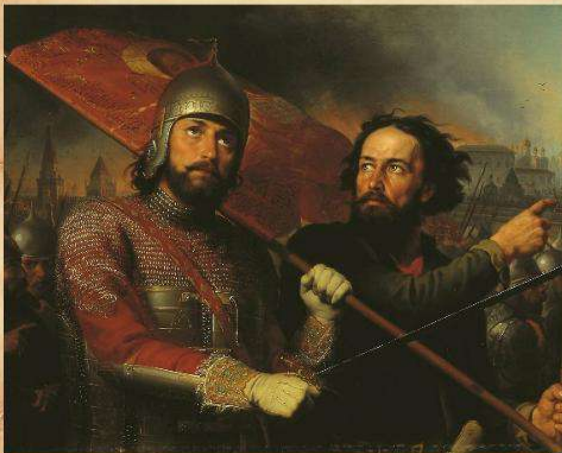
Минин и Пожарский, Скотти М.И.

Летописец сообщает: «И было тогда такое лютое время, что люди не чаяли впредь спасения себе, чуть ли не вся земля русская опустела; и прозвали старики наши это лютое время лихолетье, потому что была на русскую землю такая беда, какой не бывало от начала мира...»