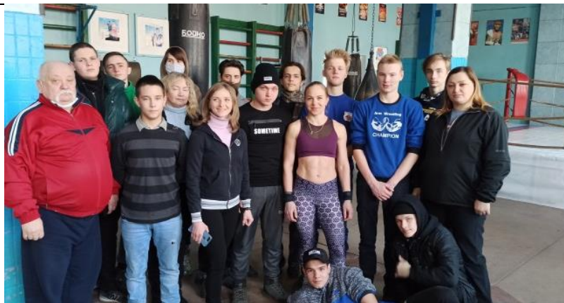
Памятное фото всех участников встречи!!