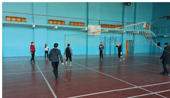
Тайм 1 Счет 1:1

Дружеская встреча по волейболу среди студентов техникума группы СМ-19 и ЭГС-19