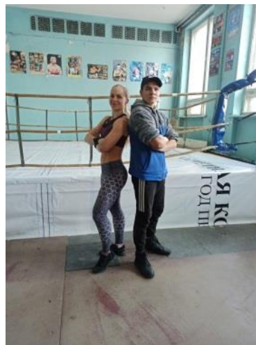
— Фото с чемпионкой!!!

Дружеская встреча по мини – футболу среди студентов ГПОУ ДЭМТ