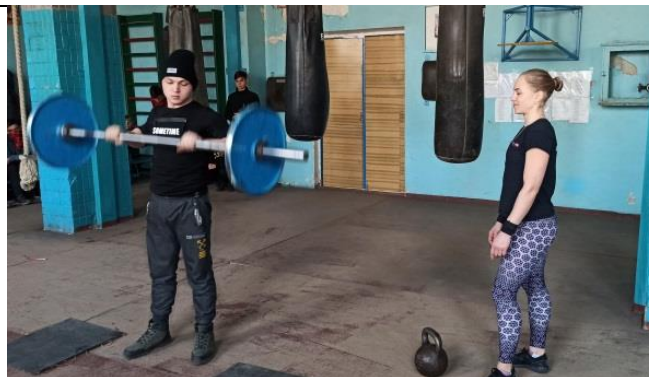
Личный пример сработал!!