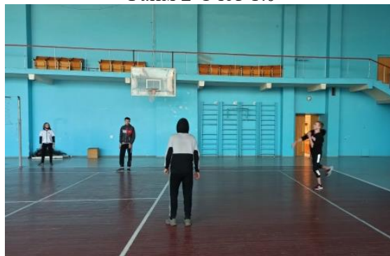
Победу одержала группа ЭГС-19