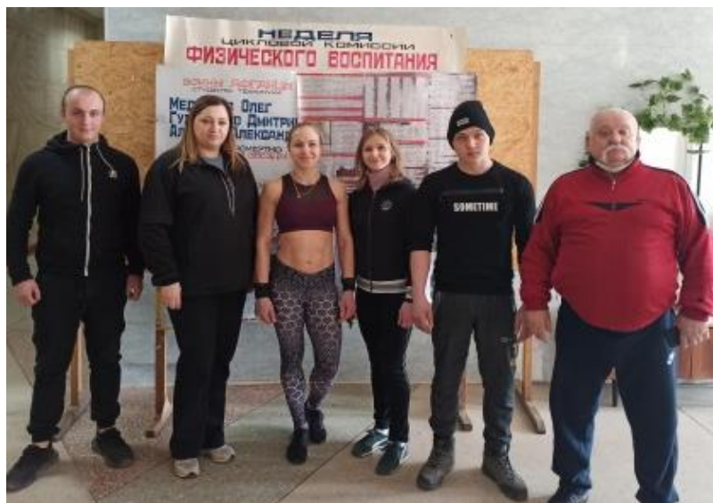
Неделя комиссии прошла успешно!