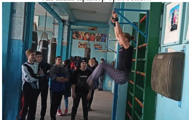
А так кто может?